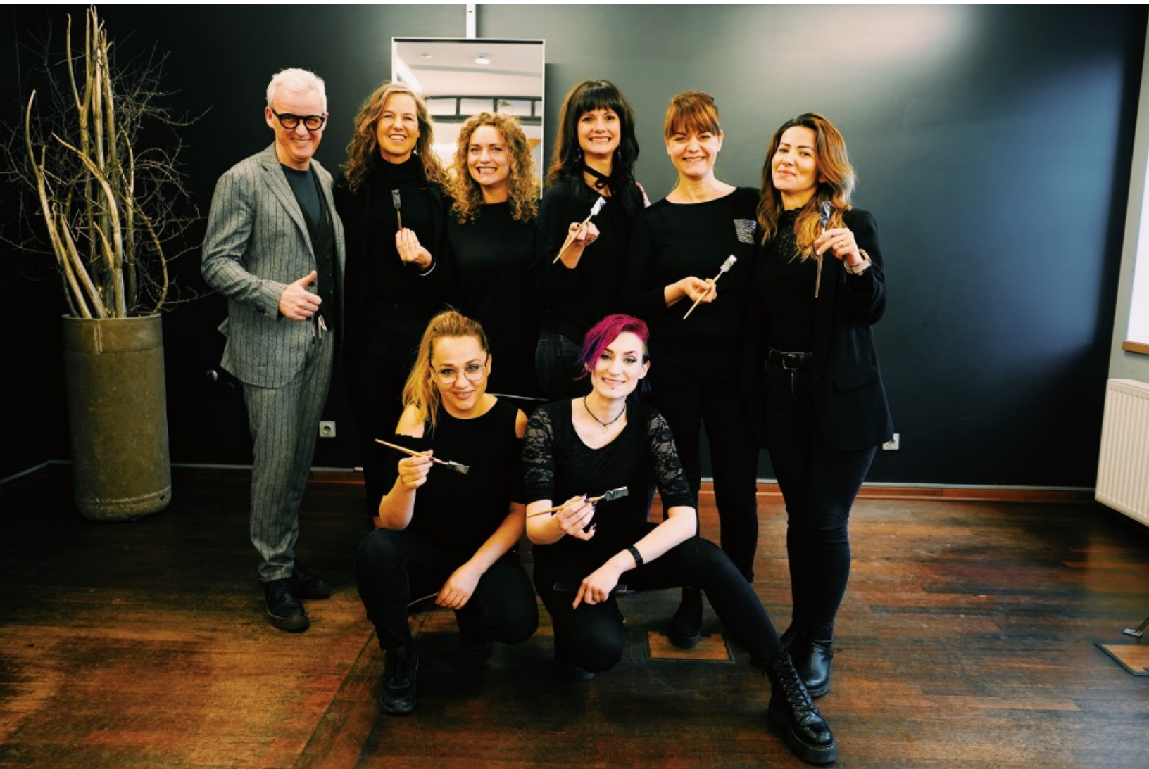
Neue Gold-Status-Stylisten bei CABELO in Münster - Foto: (c)Tatjana Jentsch - Calligraphy Cut